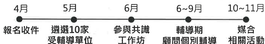
圖 1、有機農產品經營者輔導媒合計畫期程

(二) 輔導及媒合機制: 本次輔導媒合計畫包含共識工作坊 1 場次及顧問個別輔導，期間將邀請具合作意願之企業、通路及其他跨域單位，參與媒合相關活動。